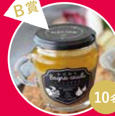
B賞 かにみそバーニャカウダ 2個入BOXセット(130g×2個)