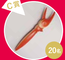
C賞 かに爪ボールペン