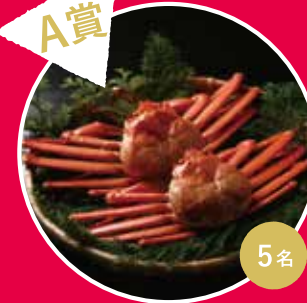
A賞 鳥取県産紅ズワイガニ 3枚セット